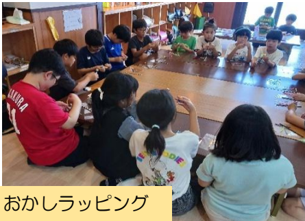
おかしラッピング