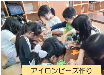
アイロンビーズ作り

冷たい風が少しずつ冬の訪れを感じさせる頃となりました。先月はハロウィンカップ作りやクッキング、お楽しみ会でのお菓子すくい、お菓子プレゼントなどハロウィンをテーマにしたイベントをたくさん行いました♪また、親子イベントでの昼食提供では多くのご家族にご参加いただき、イベントを通じて保護者の方にもKCAでのイベントの様子を知っていただけたのではないかと思います！ 今後もたくさんのイベントを企画したいと考えていますので、よろしくお願いします。