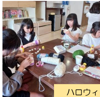
ハロウィンカップ作り